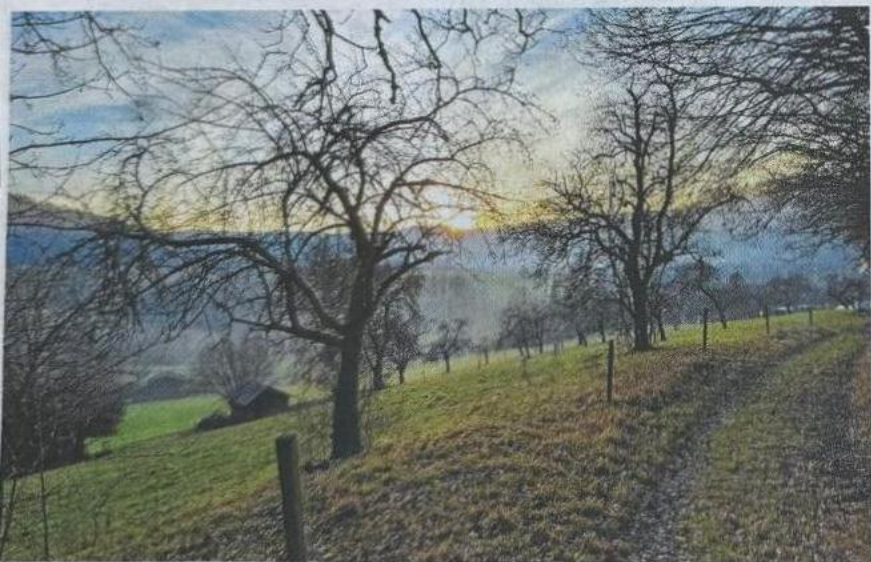
Abendstimmung über einer Streuobstwiese von Madeleine Weiser.