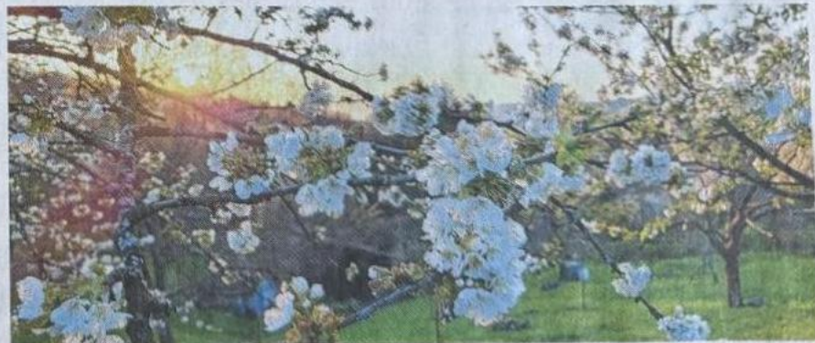
Ein Zweig in voller Blütenpracht von Bernd Schuler.